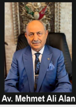
Av. Mehmet Ali Alan